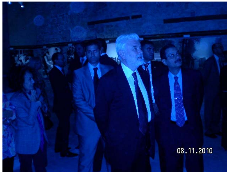
Premijer Mirko Cvetković i Dr Ahmed Darwish, državni ministar za administrativni razvoj Egipta

U istorijskom jezgru starog Kaira, u dvorcu princa od Taza iz 14. veka, u prisustvu premijera Srbije Mirka Cvetkovića ministri kulture Srbije i Egipta Nebojša Bradić i Faruk Hosni, otvorili su izložbu fotografija "Tanjug: pogled u zenicu istorije", čime je započela manifestacija Dani kulture Srbije u Egiptu. Bradić je istakao da Tanjug jedna od važnijih srpskih institucija, da je uvek mlad iako već više decenija beleži istoriju, kao što je i zajednička istorija Srbije i Egipta.